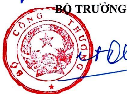
Nguyễn Hồng Diên