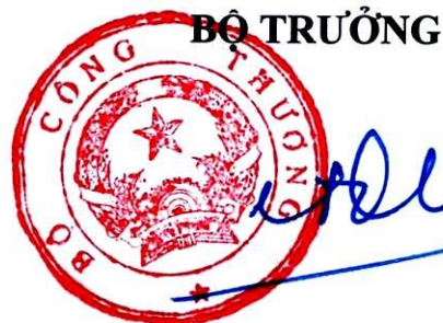
Nguyễn Hồng Diên